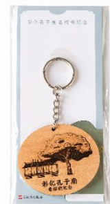
孔子廟榕樹紀念鑰匙圈